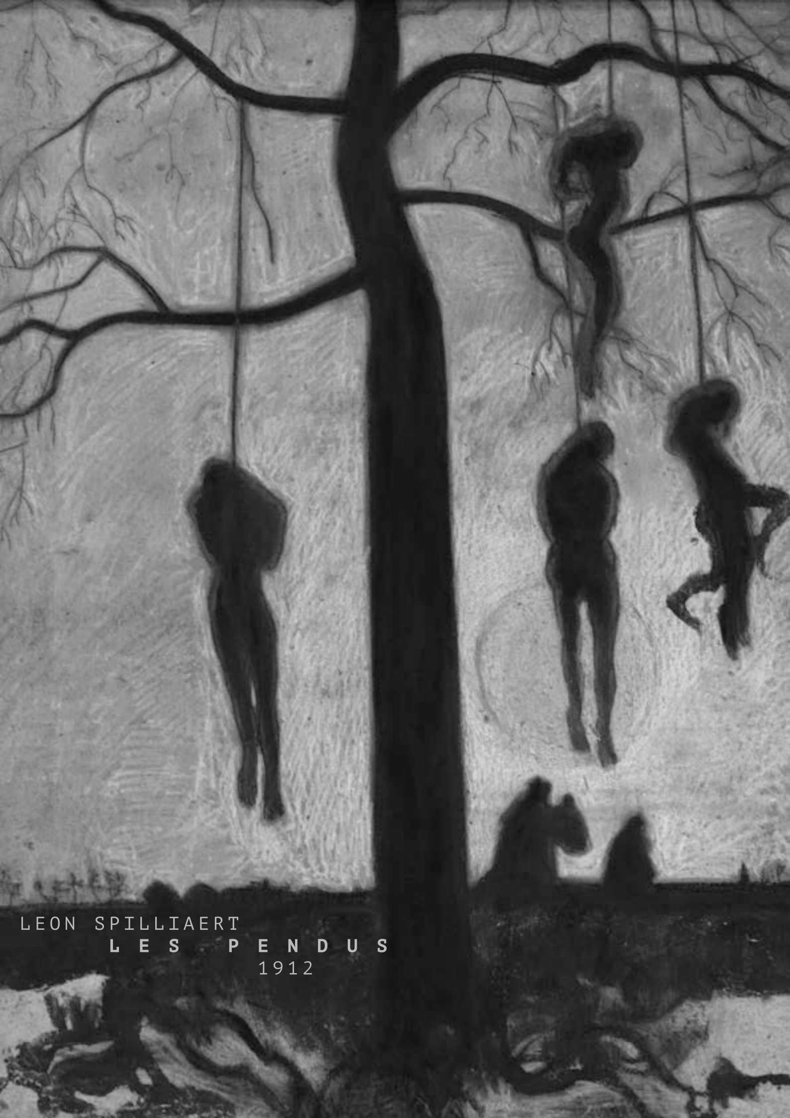
LEON SPILLIAERT LES PENDUS 1912